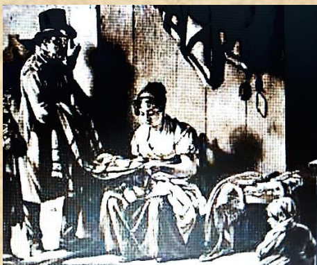
Vendeur de toile